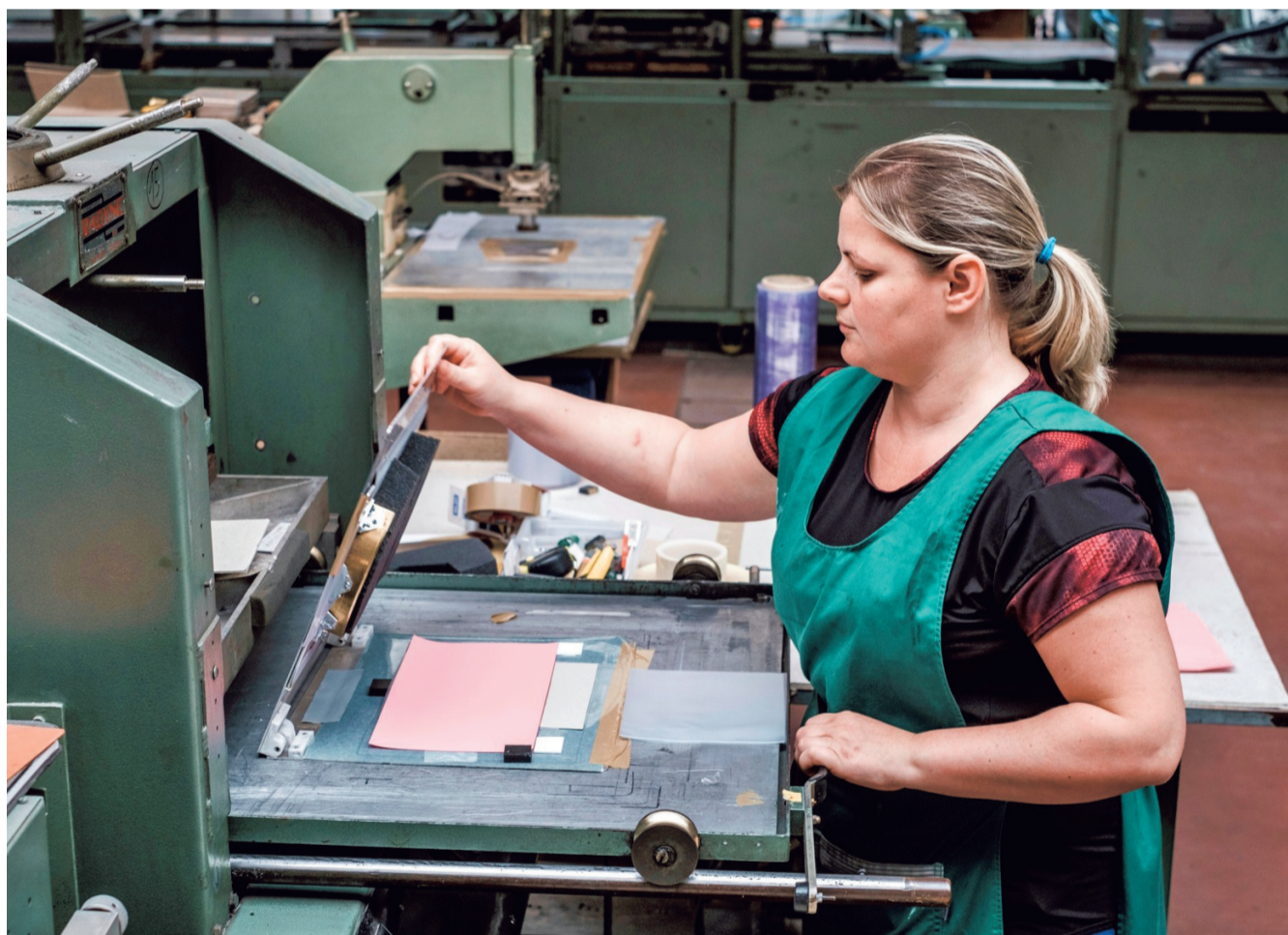
Een werknester maakt een mondmasker bij Vinya in Antwerpen. Het bedrijf nam een patent op het ontwerp.

Op vrijdag is een eerste machinestest goed verlopen. Het enige dat nog perfectieering vraagt is de elastiek, die voor ieders hoofd omtrek aanpasbaar moet zijn. "Mits enkele kleine veranderingen